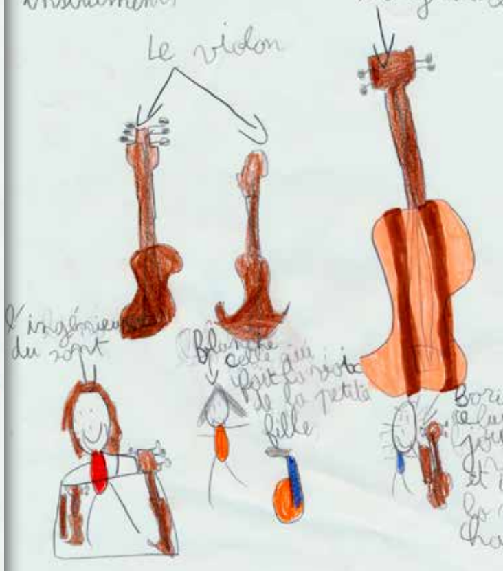
Dessins réalisés par les élèves de l'école de Saint-Suliac